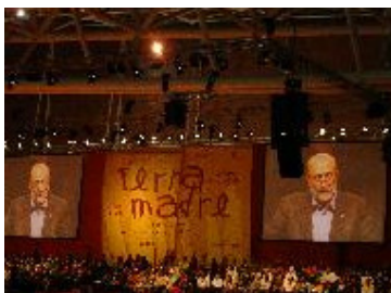
Terra Madre 2006, Turin (Italie)

OriGIn a insisté sur la nécessité pour les produits locaux d'être bien protégés à tous les niveaux afin qu'ils occupent la place qui leur est due sur le marché avec la protection intellectuelle adéquate les protégeant des abus dans un monde de plus en plus globalisé. Les bénéfices de la protection sous IG sont souvent sous-estimés par les entreprises qui abusent et utilisent librement la renommée de produits locaux. Tout ceci conduit non seulement à des effets dévastateurs sur les producteurs qui travaillent dur pour maintenir un niveau élevé de qualité tout en préservant le savoir-faire local, mais aussi trompe les consommateurs sur l'origine des produits. OriGIn croit qu'une amélioration de la protection des IG assurera une protection adéquate des produits traditionnels de qualité et bénéficiera aux consommateurs et aux communautés locales.