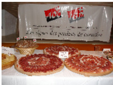
Session de dégustation des produits sous IG pendant l'Assemblée Générale Extraordinaire

Nord, d'Europe de l'Est et de l'Ouest ont examiné les activités entreprises par OriGIn ces derniers mois. Ils ont échangé leur point de vue sur l'importance de l'explication du concept d'IG à travers le monde et d'assurer une meilleure protection des IG à tous les niveaux, à partir d'exemples probants tel que les pommes Shanxi de Chine, l'huile d'Argan du Maroc ou le Café de Colombie.