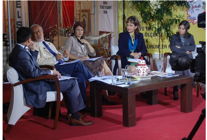
28 de Abril -1 de Mayo, Antalya (Turquía)