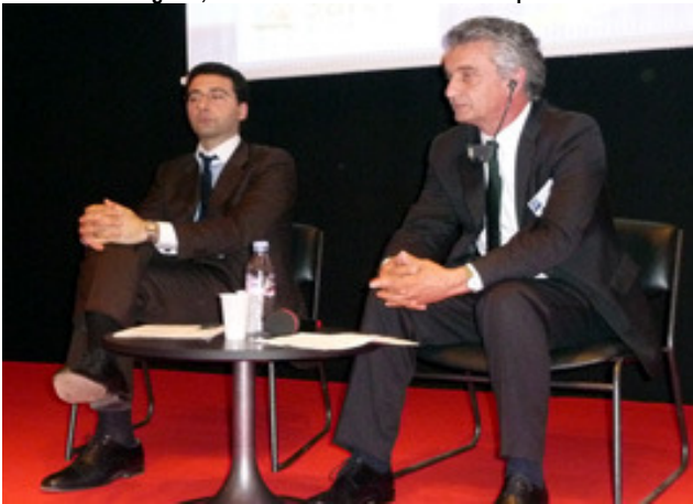
11 de Mayo, Bordoas (Francia)