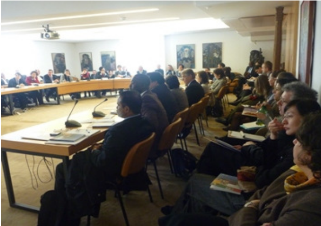
18 de Febrero, ONU, Ginebra (Suiza)