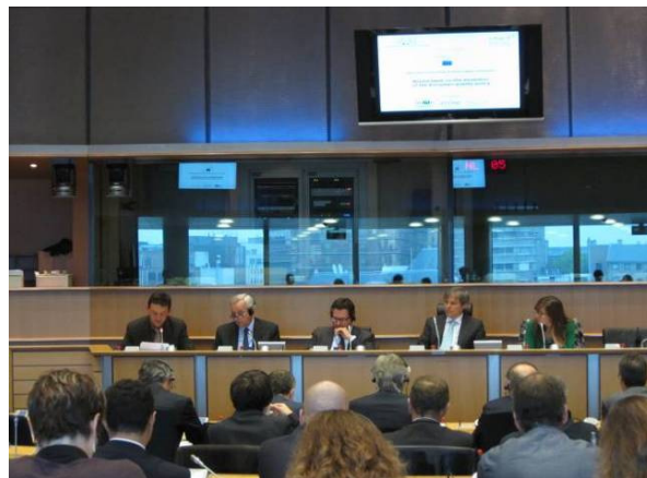
Mesa redonda sobre el desarrollo de la política de la calidad de la UE con la participación del Comisario de Agricultura y Desarrollo Rural, Sr. Dacian Cioloș. Parlamento europeo, Bruselas (Bélgica), 28 de Septiembre 2010.

La propuesta sobre sistemas de calidad solamente cubre productos alimentarios, excluyendo a las IGs de vinos y espirituosas. oriGIn considera el texto satisfactorio en su conjunto. Efectivamente, la Comisión ha tomado en cuenta algunas de las solicitudes de oriGIn. De hecho, su propuesta incorpora notablemente el reconocimiento de las funciones y de las responsabilidades de las agrupaciones de productores y de las organizaciones interprofesionales, el fortalecimiento y la clarificación del nivel de protección (la protección ex officio se define de manera clara) y el fortalecimiento de los controles a lo largo de la cadena alimentaria. Sin embargo, la propuesta no incluye las disposiciones que permitirían a las organizaciones encargadas de las IGs de manejar los volúmenes de la producción.