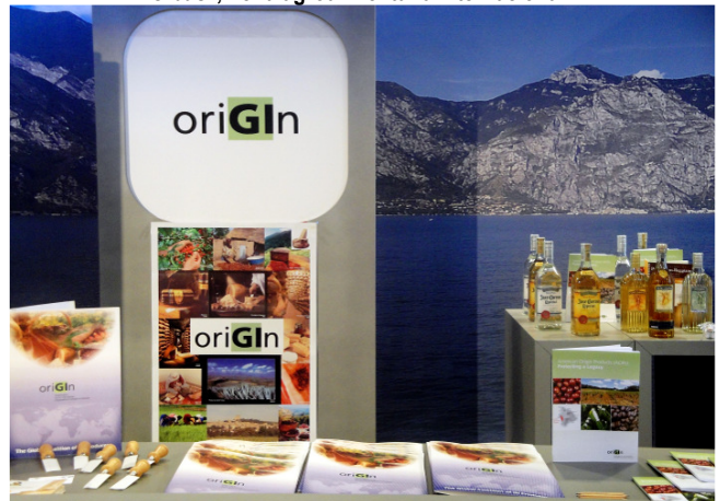
10-13 de Mayo, Parma (Italia)