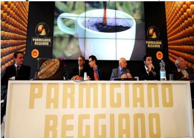
23 de Octubre, Turín (Italia)