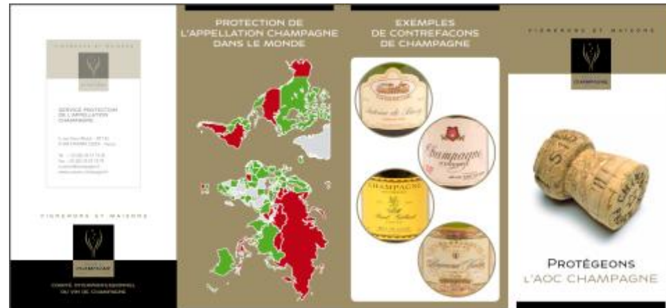
Plaquette de formation pour les douaniers