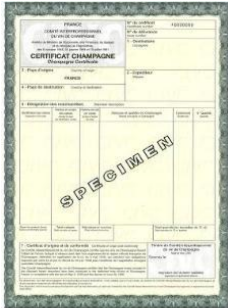
Certificat d'origine Champagne