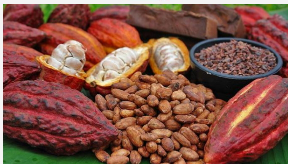
Cacao rouge du Cameroun