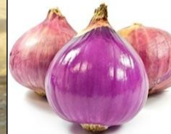
Violet de Galmi