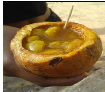
Madd de Casamance (Sénégal)