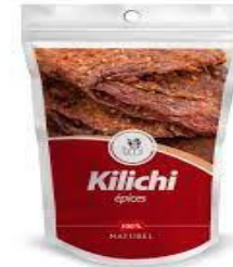
Kilichi du Niger