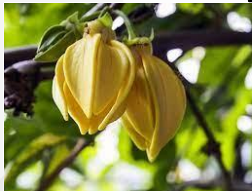
Ylang Ylang (Comores)