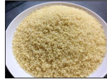
Attiéké des Lagunes (Côte d'Ivoire)