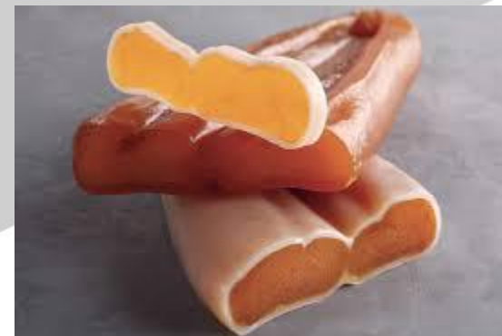
Poutargue d'Imraguen (Mauritanie)