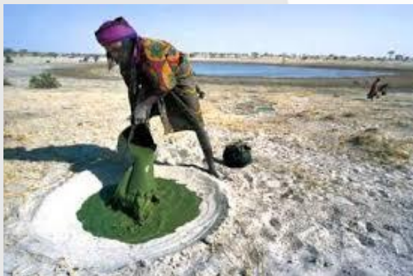
Spiruline naturelle du Tchad