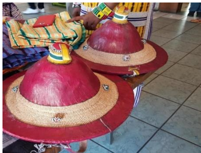
Chapeau de Saponé