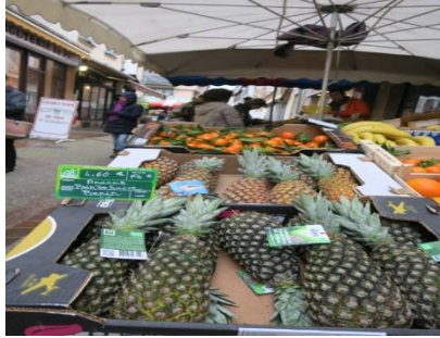
Pain de sucre du Bénin