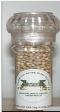
Poivre de Penja (Cameroun)