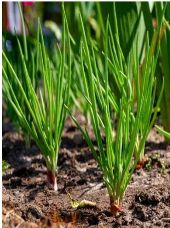
Echalote de Bandiagara