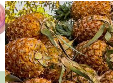
Baronne de Guinée (Guinée)